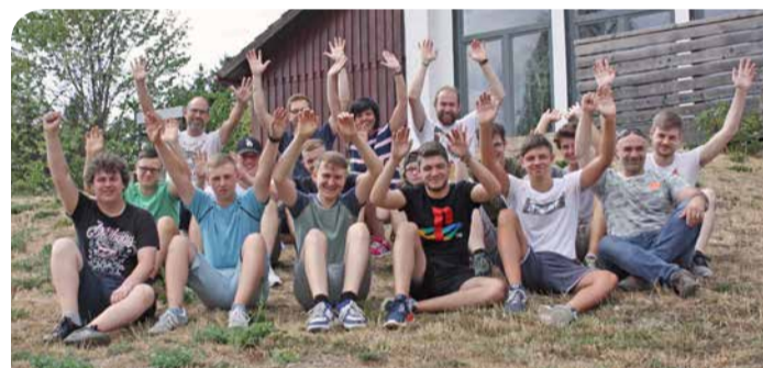
Erlebnistage im Harz – mit den neuen Auszubildenden der Werke Bernburg und Genthin.