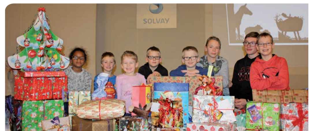
Da strahlten die Kinderaugen – Bescherung im Solvay-Werk in Bernburg

Ein ganz großes Dankeschön an alle Mitarbeiterinnen und Mitarbeiter, die sich an diesen tollen Aktionen beteiligt und dafür gesorgt haben, dass so viele Kinderaugen geleuchtet haben.