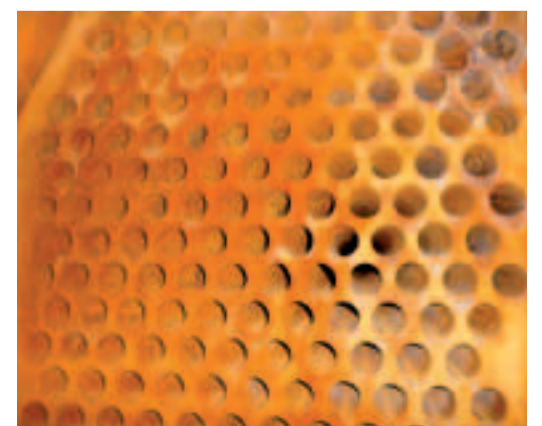
Blick in einen der drei Heizkessel.

ren wir den verbleibenden Kessel. Den Zeitpunkt nutzen wir außerdem, um auf schwefelarmes Öl umzustellen, so werden wir auch zukünftig die ab 2012 schärferen Grenzwerte zuverlässig unterschreiten.“