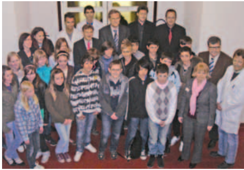
Klassen der Realschule plus Rheinbrohl besuchen regelmäßig Solvay, um sich ein Bild des Berufslebens zu machen.