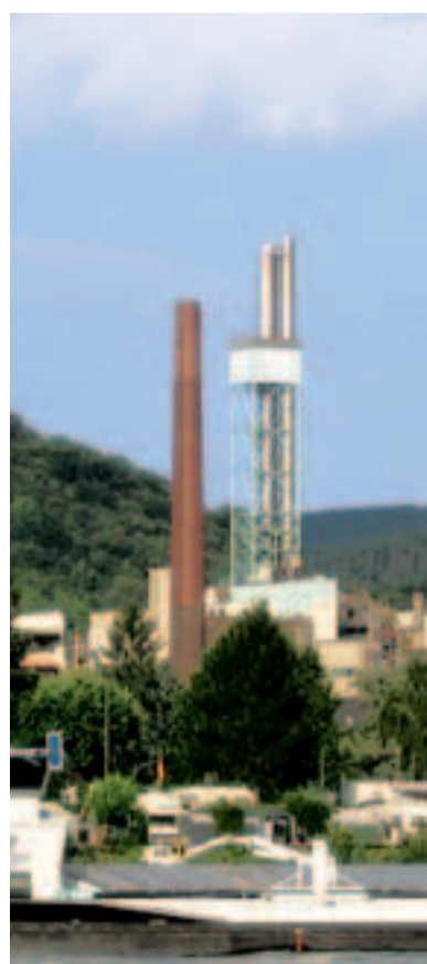
Der Backstein-Schornstein wird im Sommer um 24 Meter zurückgebaut.