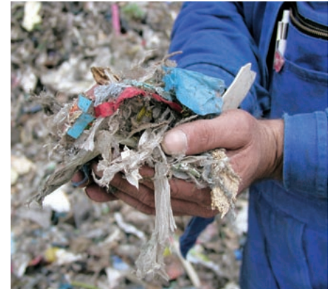
Eine Hand voll Energie – auf die Qualität der EBS wird geachtet.

Auf jeden Fall. Der Bau sichert eine umweltverträgliche Nutzung der Abfälle und macht Transporte ins Ausland überflüssig. Außerdem schafft und sichert das Projekt Arbeitsplätze. Nicht nur bei Solvay in Bernburg – sondern auch in Oppin und den umliegenden Ortschaften.