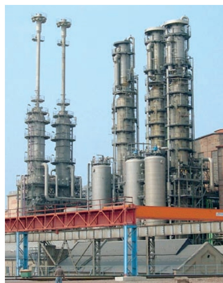
Die Sodaproduktion im Solvay-Werk Bernburg braucht Strom und Dampf zu wettbewerbsfähigen Preisen.

Im Mai schließlich reichte die Energie Anlage Bernburg GmbH (EAB) den Genehmigungsantrag für den Bau eines EBS-Heizkraftwerks beim zuständigen Landesverwaltungsamt Halle ein. In den Folgewochen prüften die Fachabteilungen